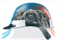
従来品とエアライト搭載品の頭頂部付近の温度変化比較